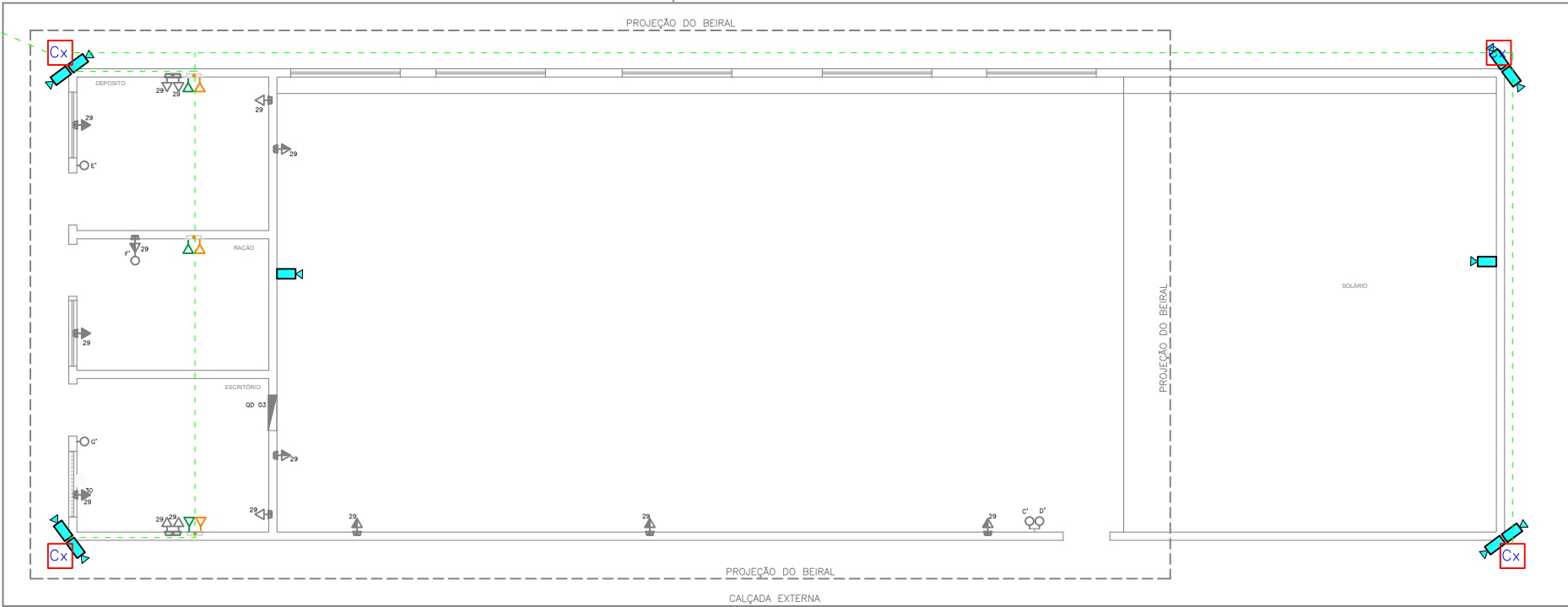
PLANTA BAIXA - GATIL/SOLARIO ESCALA: 1:100